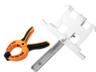
Kit di montaggio per misuratore di energia solare per pannelli fotovoltaici