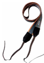
M1 cinghia di supporti