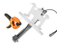
Kit di montaggio per misuratore di energia solare per pannelli fotovoltaici + sonda per la misurazione della temperatura dei pannelli fotovoltaici e dell'ambiente