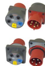
Adattatore presa trifase industriale 16 A / 32 A