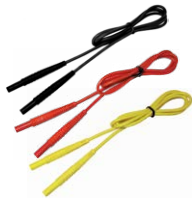
Cavi di prova 1,2 m (terminale banana) nero / rosso / giallo